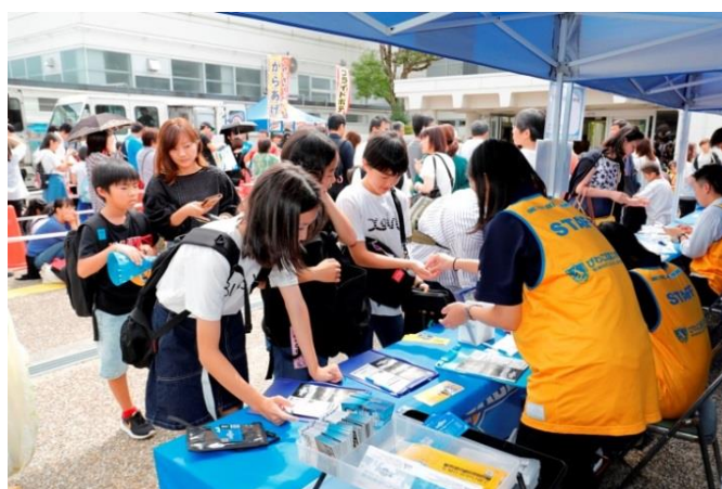
受付業務を担当するボランティアスタッフ