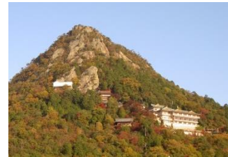
太郎坊宮(阿賀神社)

本殿へは、夫婦岩と呼ばれる2つの巨岩の間を通って行き、嘘つきは岩に挟まれてしまうといわれます。