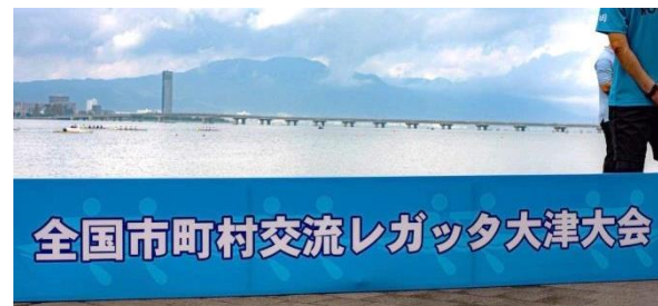
全国市町村交流レガッタ大津大会

もちろん、WMG2021関西や地元観光のPR等も実施。暑さの残るなか、WMG特製うちわは引っ張りだこ。「WMGに毎回参加しているよ。」「2021年は大津にまた来ますよ!」といった声も多かったです。WMG2021関西に向けた手ごたえを感じました。こうした交流大会の開催実績も生かしながら、国内外の多くの方に当地を満喫いただけるよう、しっかり準備を行っていきます。