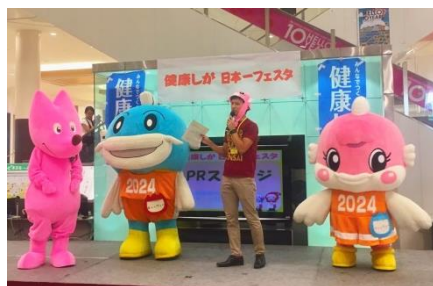
対決を前に気合十分のキャラ達

滋賀県ではWMG2021関西に加え、東京2020オリンピック・パラリンピックや2024年の国民スポーツ大会・全国障害者スポーツ大会と連携したPR活動を行っています。