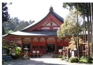
大津市 比叡山延暦寺