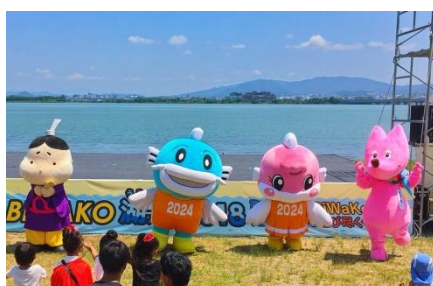
汗一つかかず愛嬌をふりまくプロ意識高きキャラ達

男女の平均寿命および健康寿命がトップクラスである健康長寿県として、「健康しが」づくりに向けたキックオフイベント『「健康しが」日本一フェスタ』(平成30年7月21日(土)開催)において、スフラ達と景品をかけたスポーツガチンコ対決など観客参加型の催しを行い、会場を盛り上げました。