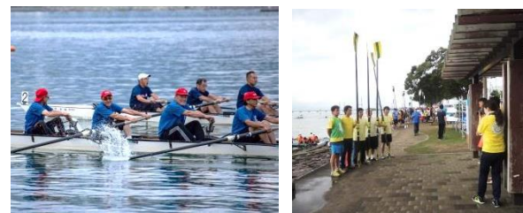
琵琶湖(瀬田川)を舞台にボートで交流