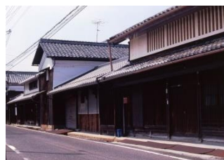
守山市 中山道守山宿

中山道は、徳川幕府が制定した五街道の一つで、守山は東下りの第一番目の宿として「京発ち守山泊まり」で旅人に知れ渡っていました。