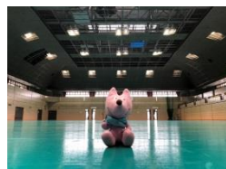
京田辺市 田辺中央体育館 府立山城総合運動公園 (ハンドボール)