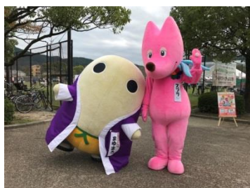
京都府広報監まゆまるも駆けつけてくれました!(京都国際映画祭)