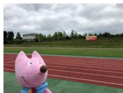
京丹波町 府立丹波自然運動公園 (ゲートボール)