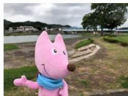
南丹市 大堰川緑地公園周辺 (デュアスロン)