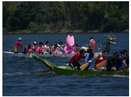
懸命にパドルするスフラとクルーたち 全員が初出場ながら奮闘、大会を盛り上げました！

カヌー競技(マラソン)の開催地、京丹後市久美浜湾カヌー競技場で毎年開催されている「千日会観光祭2018京丹後市ドラゴンカヌー選手権大会～メロンカップ～」(平成30年8月5日(日)開催)に参加し、広報活動を行いました。大会には京都府内外から91チーム、約1,000人が参加し、気温37℃の猛暑の中、熱戦が繰り上げられました。会場ではW MG2021関西のPRのため、大会参加者全員にチラシを配布、また場内放送でもアナウンスを行いました。さらに、京都府職員、組織委員会職員、スフラで「ワールドマスターズゲームズ2021関西に出よう！」チームを結成し、競技に参加しました。観客からは、「あのピンクのキャラクター何?」「暑くないかなぁ～」「海に落ちたらどうするんやろ」など、さまざま声をかけられつつも、見事にレースをフィニッシュしました。競技終了後は、拍手で迎えられ、握手や写真撮影などで観客とふれあい、大会をPRしました。