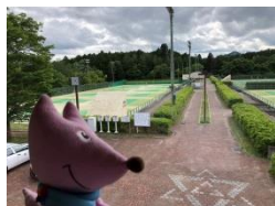
福知山市 三段池公園 (ソフトテニス)