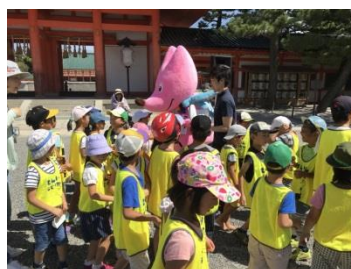
子どもたちに大人気♪(1000日前記念イベント)