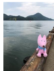
京丹後市 久美浜湾カヌー競技場 (カヌー)

京都府実行委員会では大会に向け、京都府基本計画を作成しています。現地調査では、実行委員会事務局職員、開催市町職員、競技団体、施設の職員及びスフラが立ち会い、施設や設備の現状、動線などの確認と意見交換を行いました。この調査により、競技会場の現状を把握するだけでなく、輸送計画をたてる上で不可欠な、会場施設周辺の宿泊施設や交通状況についても把握することができました。今後も開催市町や競技団体と調整を行い、30年度中の策定を目指しています。