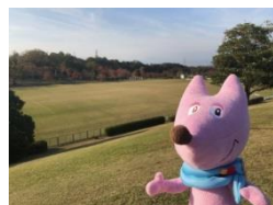
宇治市 府立山城総合運動公園 (フライングディスク)