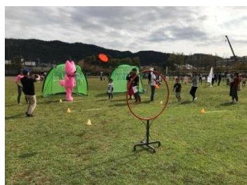
フライングディスクで予想外の腕前を披露(京都国際映画祭)

10月13日、「京都国際映画祭」のサイドイベントの一つとして、「よしもとスポーツパーク」が岡崎公園野球場で開催されました。当日は、京都府レクリエーション協会の協力も得て、各種スポーツ体験をシールリレー形式で行い、約1,000人の来場者に体験してもらいました。各ブースでは吉本興業所属の若手芸人が参加し、来場者と共に競技を行ったり、応援をしたりするなど体を張って盛り上げていました。