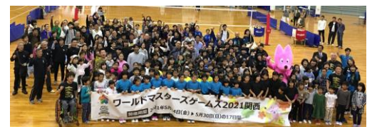
たくさんの方が参加され、大いに盛り上がりました。

組織委員会は、大会レガシーの創出のため、今後も開催府県市を中心に事業を展開していきます。