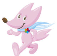
大会マスコットスフラ ～Sport for Life～