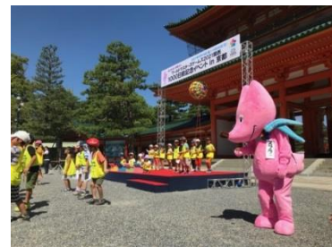
児童と共にけん玉を披露するスフラ(1000日前記念イベント)

8月23日に京都市実行委員会と共に「1000日前記念イベント in 京都」を平安神宮 応天門前で開催しました。平安神宮が位置する岡崎エリア一帯では、2021年5月14日に開会式が行われます。当日は、近隣の児童館の子どもたちによるステージ発表、デジタル残日計のお披露目及び山内修一京都府副知事、門川大作京都市長らによる挨拶があり、テレビ、ニュースなどメディアでも取り上げていただきました。