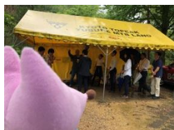
和束町 湯船 MTB LAND (マウンテンバイク)