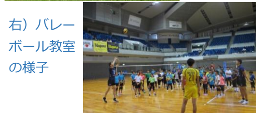
右) バレーボール教室の様子