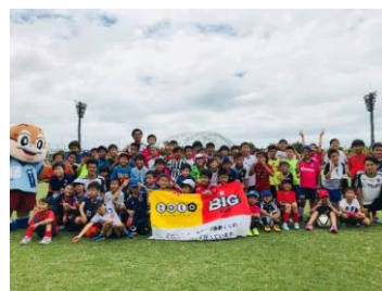
左) 教室後にみんなで記念に「パシヤ!!!」

プロの本格的な技術指導と子どもたちの誰もが熱中できる催し内容に、参加者からは「勉強になった」「楽しかった」「来年も参加したい」と大満足で、短時間で成長する子どもたちの姿に、保護者の方からも「非常に良い経験をさせてあげることができた。保護者も参加できるようにしてもらいたい」と嬉しい言葉をいただきました。