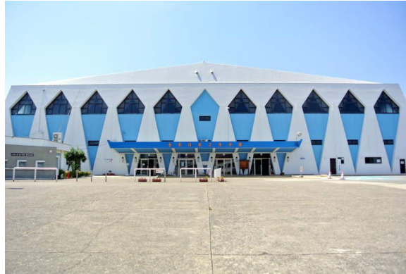
■和歌山県立体育館