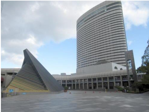
■ポートアイランド（市民広場）